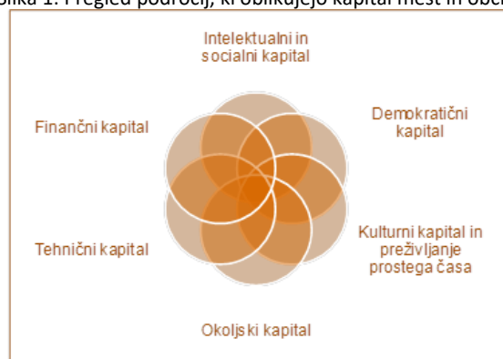
Slika 1: Pregled področij, ki oblikujejo kapital mest in občin

Za določitev smeri razvoja je pomembno razumevanje stanja razvitosti posameznih področij in izzivov, s katerimi se srečujemo.